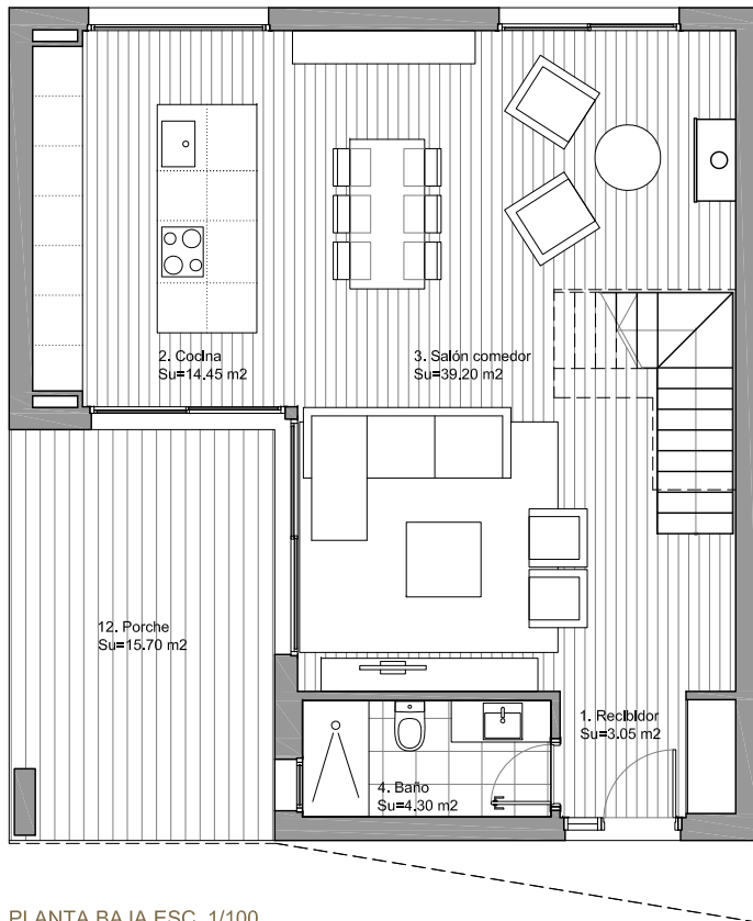
PLANTA BAJA ESC. 1/100