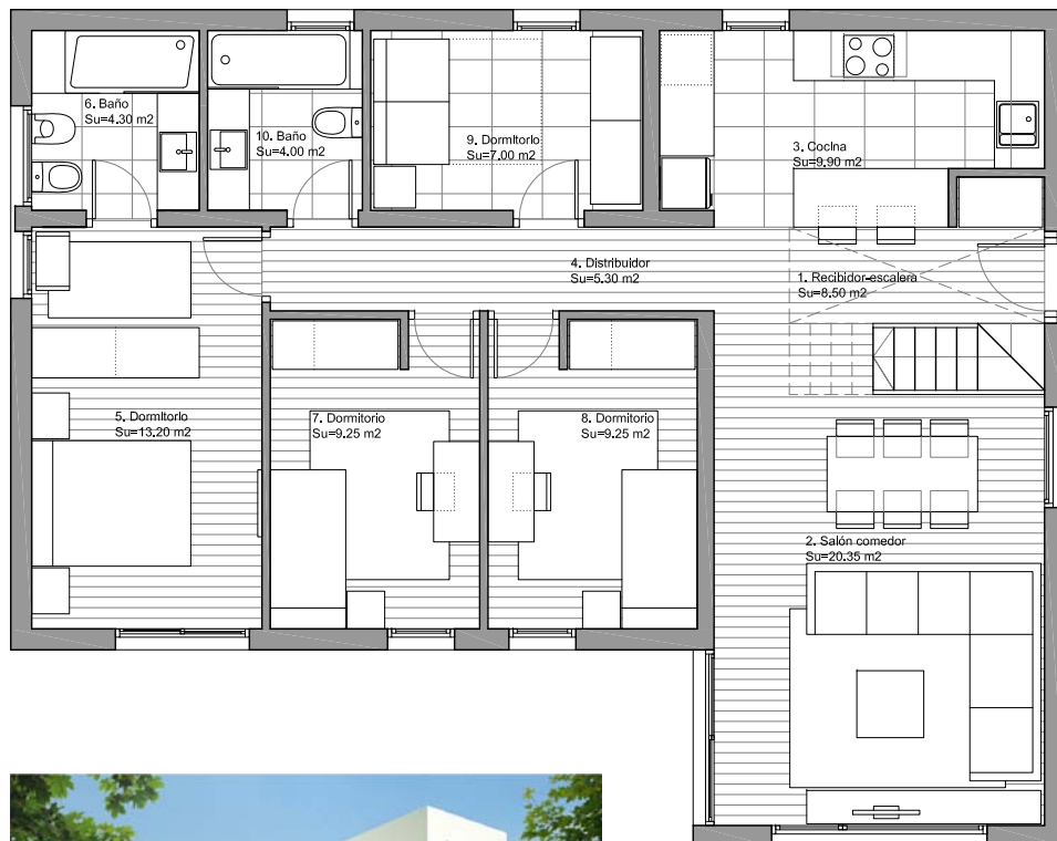
PLANTA BAJA ESC. 1/100